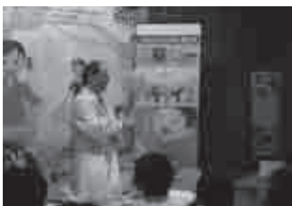
実験ショー 科学マジックのようす

とき: 8月20日(土)～9月4日(日)の土・日曜日午前11時50分、午後2時20分(各約25分) ところ: 地下資源館(大岩町字火打坂) 内容: 身のまわりにある材料を使って、かんたんに楽しめるふしぎな実験を紹介します 参加料: 無料 申し込み: 不要 問合せ先: 地下資源館(☎41・2833)