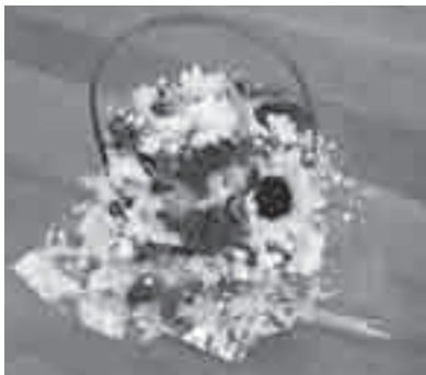
フラワーアレンジメントの作品例

とき: 9月6日(火)午前9時～午後3時30分 ところ: JA愛知みなみマムポートセンター(花き出荷場)、サンテパルクたはら、あぐりパーク食彩村※バス使用 集合・解散: 豊橋市役所またはサンテパルクたはら(田原市野田町芦ヶ池) 内容: JA愛知みなみマムポートセンター(花き出荷場)の見学、地産地消ランチバイキング、地元の花をつかったフラワーアレンジメント教室 定員: 30人(抽選) 参加料: 3,500円(昼食代など) 申し込み: 8月18日(必着)までに住所、氏名、年齢、電話番号を豊橋田原広域農業推進会議事務局(農政課内〒440-8501住所不要☎56・5130☒info_nosei@city.toyohashi.lg.jp) 問合せ先: 豊橋田原広域農業推進会議事務局(農政課内☎51・2464☒http://www.toyohashi-tahara.jp/)