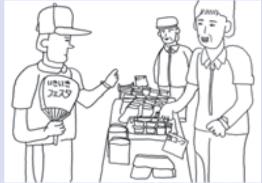
イラストは障害者の自立支援を目的に、豊橋障害者(児)団体連合協議会の協力を得て作成したものです