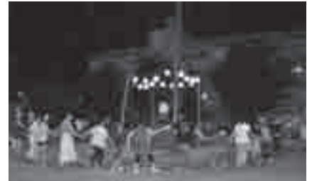
昨年の盆踊りのようす

とき: 9月3日(土)午後6時～9時(雨天順延4日(日)午後5時～8時) ところ: 青少年センター(牟呂町字東里) 内容: 豊橋市青年団協議会による盆踊りと豊橋技術科学大学吹奏楽部による演奏、露店、お菓子まきなど 参加料: 無料 その他: 8月28日(日)午後7時から青少年センターで盆踊りの練習があります 申し込み: 不要 問合せ先: 青少年センター(☎46・8925)