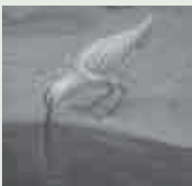
くちばしで泥中のゴカイを採るチュウシャクシギ(自然史博物館内の模型)

私たち哺乳類は食性の違いにより歯の形が異なっています。が、歯が退化して無い鳥類は、「くちばし」が食性に合った形をしています。肉食の鳥のくちばしは、肉を切り裂きやすいように鉤状に曲がった鋭い形を、堅い殻や皮に包まれた種を食べる鳥のくちばしは、太くて頑丈な形をしています。自然史博物館の郷土の自然展示室のジオラマ「干潟の生きもの」に展示してあるチュウシャクシギのような干潟の砂泥中に棲む小型動物を食べる鳥のくちばしは、それらをつまみやすいように細長い形をしています。くちばしの形と食性に注目して、干潟の鳥を見てみるのも面白いですよ。