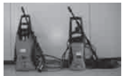
BLACK & DECKER製高圧洗浄機

対象: 530運動で高圧洗浄機を利用する団体または学校、公民館などの公共施設をボランティアで清掃する方 ※個人・事業所所有の建物、車両などの清掃は不可 内容: 高い水圧で汚れを落とす高圧洗浄機を貸し出します 貸出機種／台数: BLACK & DECKER製高圧洗浄機／2台(申込順) 貸出期間: 1週間(1回1台) 利用料: 無料 申込先: 市役所環境政策課(西館5階☎51・2399)