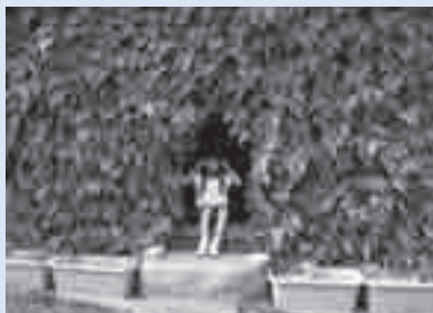
平成23年度家庭部門最優秀作品

8月31日（必着）までに応募用紙と緑のカーテンの設置状況が分かる写真を温暖化対策推進室（〒440-8501住所不要） ondanka@city.toyohashi.jp ※応募用紙は温暖化対策推進室ホームページで配布