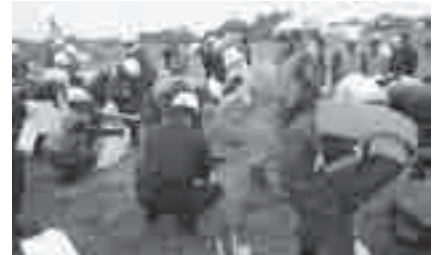
昨年の水防訓練の様子

とき: 5月18日(金)午前9時30分 ところ: 大村町の豊川河川敷 問合せ: 防災危機管理課(☎51・3126)