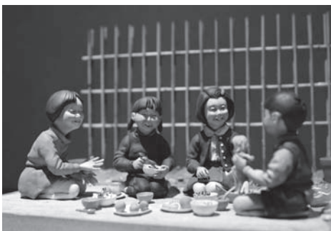
山田さん製作のジオラマ

ころ ザザシテイ浜松中央館(浜松市中区鍛冶町) 入場料 大人400円、中・高校生200円、小学生以下無料 問合せ先 浜松ジオラマファクトリー(☎053・489・3725 http://hamamatsu-diorama.com/ )