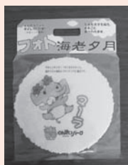
新商品 「フォト海老夕月」

大人の顔よりも大きなえびせんに、マールと豊橋市のマスコットキャラクター「トヨッキー」のかわいいイラストを描きました。価格は525円(2枚入)で、中央門売店・東門売店・西門売店で販売中です。