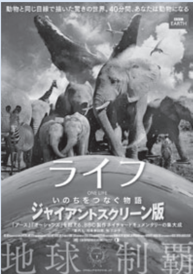
「ライフいのちをつなぐ物語」