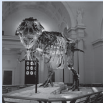
「スーの物語 WAKING THE T. REX」

けられてシカゴのフィールド博物館で多くの来館者を魅了している。6700万年の時を超えて「スー」の物語が今、明かされる。 上映時間 23分(総入れ替え制) 観覧料 大人400円(320円)、小人(中学生以下)200円(160円)※( )は30人以上の団体料金 ■共通事項 上映期間 9月13日(水)〜来年2月28日(木) (12月1日(土)・2日(日)は上映中止) 休館日 月曜日(月曜日が祝日の場合は翌平日)、12月29日〜来年1月1日 ところ 特別企画展示室 座席数 320席 上映スケジュール 土・日曜日、祝