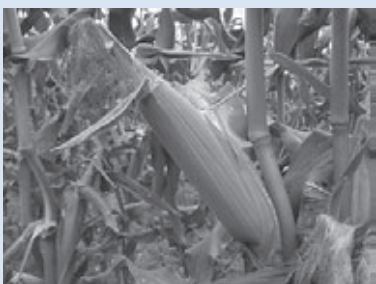
おいしい南信州のとうもろこし