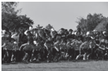
昨年の豊橋みなとシティマラソン(さわやかジョギング)スタートのようす