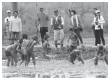
親ガモの会のみなさんと田植えのようす(賀茂小学校)