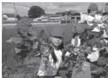
「すくすく下条っ子農園」での枝豆収穫のようす(下条小学校)