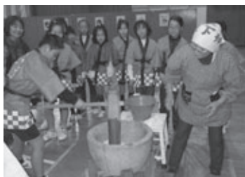
もちつき会(米作りの一環)のようす(高山小学校)