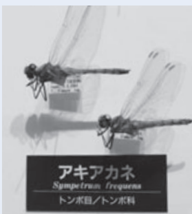
アカアカネ(自然史博物館郷土の自然展示室)

アカトンボの姿に秋の深まりを感じる方も多いのではないのでしょうか。アカトンボはアカネ属のトンボの総称で、その代表種がアカアカネです。アカアカネは豊橋平野などの平地の水田で育ち、初夏に成虫になると、茶臼山などの高い山へ移動します。そして、秋が深まると生まれ故郷に戻り、収穫を終えた水田に産卵します。日本各地どこでも普通にいたトンボです。ところが最近、そのアカアカネが見られなくなりました。原因は、イネの外來害虫駆除のための新しい農薬の影響とする説が有力です。入れ替わりに繁殖力の強いウスバキトンボという南方系のトンボが増えたことで、多くの人はそれをアカトンボと見間違え、本物の減少にすら気づいていません。