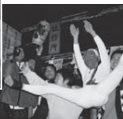
霜月まつりのようす(飯田市南信濃木沢)