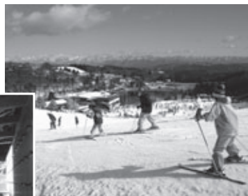
茶臼山高原スキー場