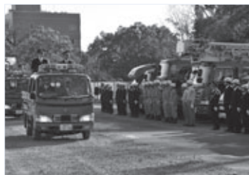
昨年の消防出初式の様子

とき: 1月6日(日)午前9時～11時40分 ところ: 市民プール駐車場(豊橋公園内) 内容: 市長の観閲、徒歩部隊・消防車両からなる分列行進、消防団員による伝統のはしごのり演技、消防団広報活動支援隊によるラップ演奏、消防音楽隊とカラーガード隊による演奏・演技、一斉放水 問合せ: 消防本部総務課(☎51・3111)