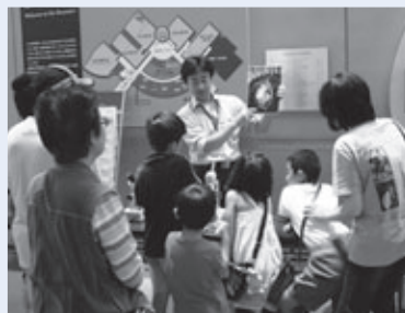
学芸員とおしゃべりタイムの様子

魚の歯を知る とき: 1月12日(土)午後1時30分(約30分) 内容: 魚の歯、あごのいろいろについてお話しします