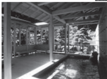
兎鹿嶋温泉 湯くらんどパルとよね

また、お立ち寄りいただき、ほっと温まり、疲れを癒やしてお帰りください。 問合せ先 茶臼山高原スキー場(☎0536・87・2345)、兎鹿嶋温泉湯くらんどパルとよね(☎0536・85・1180)