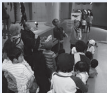
ボランティアガイドツアーの様子

とき: 1月5日(土)・12日(土) 午後1時・2時(各約30分) 内容: イントロホール、常設展示室の見どころを最近の話題をまじえわかりやすく案内します