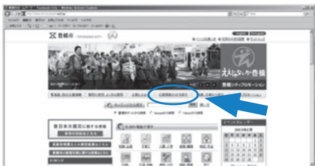
豊橋市トップページの「広報掲載のHPを探す」をクリックしてください

「広報とよはし」には、詳細をホームページで見ただけのよう、アドレスを記載している記事があります。このような場合、アドレスを直接入力しなくても、クリックするだけで該当ページに移動できるようにリンク集を用意しています。豊橋市トップページの上の方にある「広報掲載のHPを探す」をクリックしてください。広報紙に掲載されているホームページへのリンクが一覧表になっていますので、ぜひご活用ください。※過去1年分についても掲載していますが、リンク切れの場合もあります