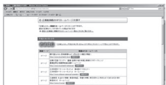
「広報とよはし」掲載記事のホームページへリンクしています