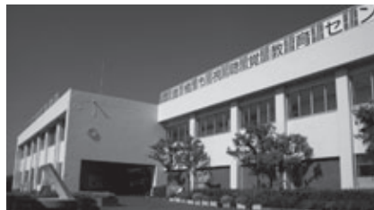
視聴覚教育センター

対象: 1年のうち土・日曜日、祝・休日に5回以上活動が可能な方 活動内容: 視聴覚教育センター・地下資源館で行われるワークショップの企画と実施(指導のほか、準備・受け付けなどの補助作業) 募集人数: 10人程度(選考) その他: 報償費・交通費・食事代などの支給はありません。4月28日(日)午後1時～3時に新規申込者を対象に説明会を開催します 申し込み: 3月20日～4月16日(必着)に、はがきで住所、氏名、年齢、電話番号、希望する活動内容を視聴覚教育センター(〒441-3147大岩町字火打坂19-16 ☎41・3330)