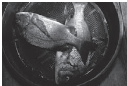
たきや漁でとれたクロダイ。船頭さんがいかに筏の上で調理してくれます

さまざまなレジャーをはじめ、豊かな自然や美しい景色など、1年を通じてその魅力を満喫できる浜名湖。その浜名湖で、春から秋にかけて行われる伝統の漁「たきや漁」を体験することができます。 たきや漁は、夜の浜名湖で漁船の上から明かりを照らし、クルマエビやカニ、クロダイ、タコなどの獲物を、モリで突いたり、網ですくったりする浜名湖ならではの漁法。漁を体験したあとは、とれたての魚などをその場で調理して味わったり、持ち帰りすることもできます。 伝統的な漁ととれたての浜名湖の幸を、ぜひお楽しみください。 ■たきや漁体験 とき 4～10月 その他 漁の詳細や定員、料金、予約方法などについては、お問い合わせいただくか、ホームページ( http://takiyayouu ).