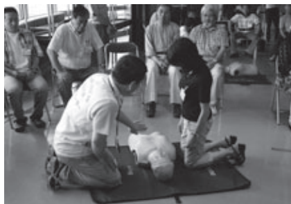
とよはし防災リーダー養成講座(昨年度の様子)

とき: 6月22日(土)、7月6日(土)・20日(土)、8月3日(土)(全4回) 午前9時～午後4時(最終日は午前11時まで) ところ: 市役所講堂(東館13階) 対象: 市内在住で自主防災組織と連携し、地域の防災リーダーとして活動が可能な方 内容: 防災危機管理課職員による防災講話、避難所の開設(ワークショップ)、講話「豪雨災害と災害情報」「気象情報を災害に活かす」、普通救命講習など。講座修了者のうち希望者は、NPO法人日本防災士機構が認証する「防災士」の受験資格を取得できます(受験は最終日午後1時) 講師: 牛山素行さん(静岡大学准教授)ほか 定員: 30人(申込順) 受講料: 無料(防災士を受験希望の場合は、テキスト代など11,000円必要) 申し込み: 5月31日までに市役所防災危機管理課(西館4階☎51・3127)