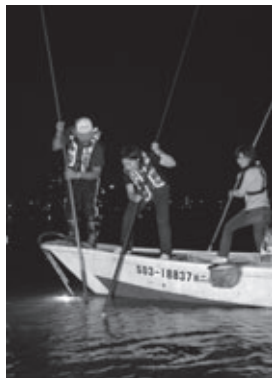
長いもりで獲物を狙う