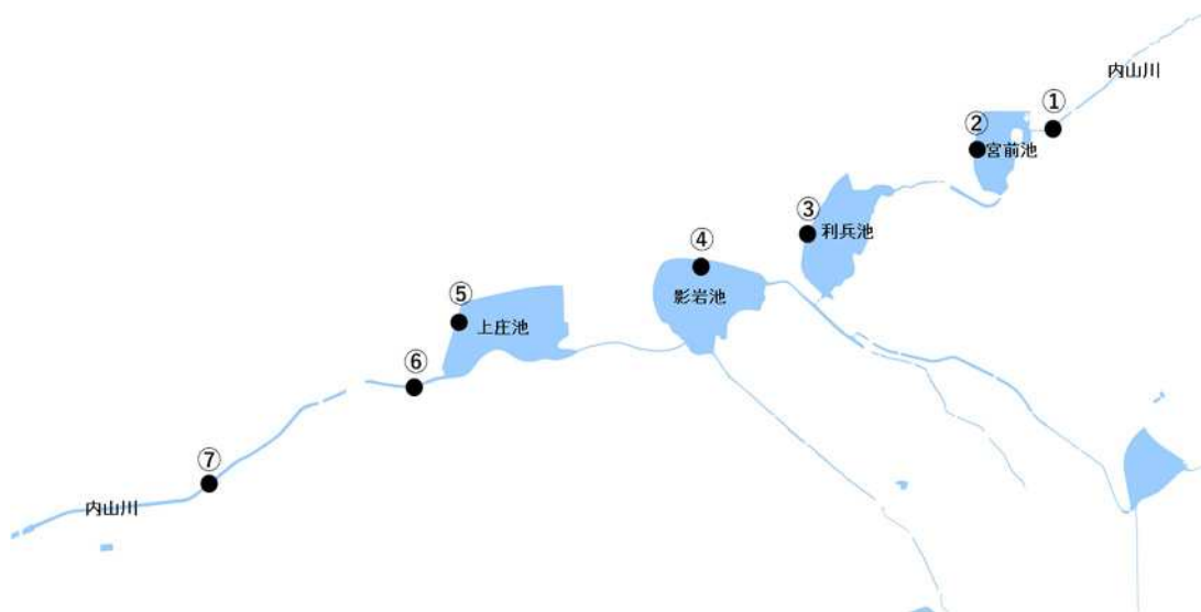
「内山川 黒福橋」追跡調査地点図