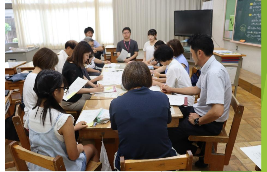
CS熟議 校内の安全を点検しよう