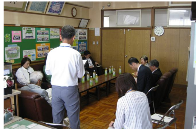
第1回学校運営協議会の様子