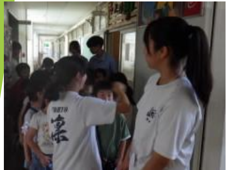
中・高生ボランティア