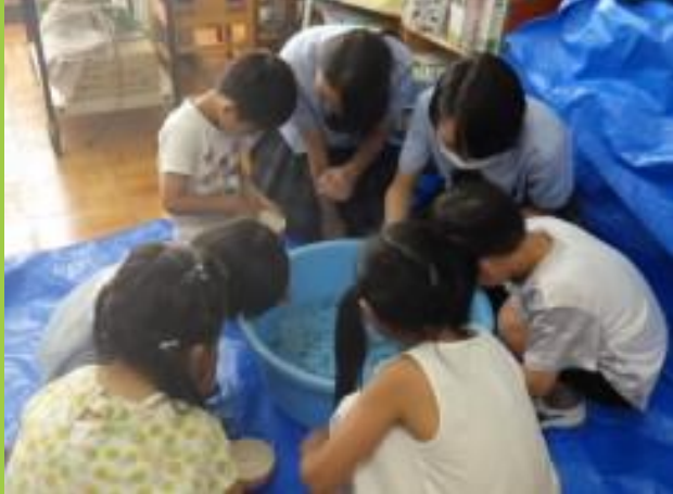
桜丘高校・生物部の授業