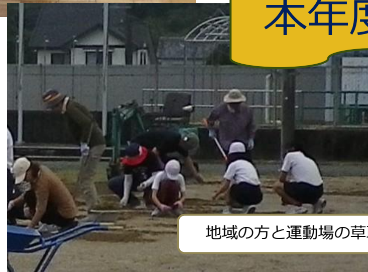
地域の方と運動場の草取り