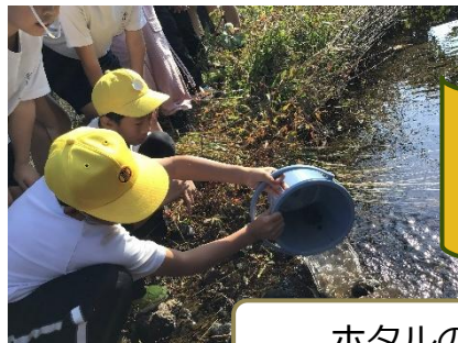
ホタルの飼育活動