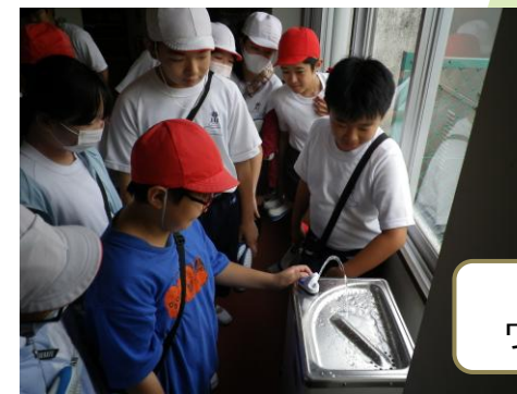
PTAより ウォータークーラーの寄附