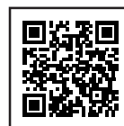
防災管理 定期点検報告