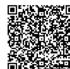
Modo de verificar o resultado do exame de saúde

https://www.city.toyohashi.lg.jp/secure/108285/mainakenshinkekka.pdf