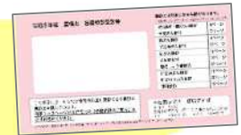
Tabela simplificada dos exames de câncer (por idade*)

Se não tiver o cupom do exame de câncer do ano adm. 2026 (R8) do município de Toyohashi, não poderá realizar o(s) exame(s).