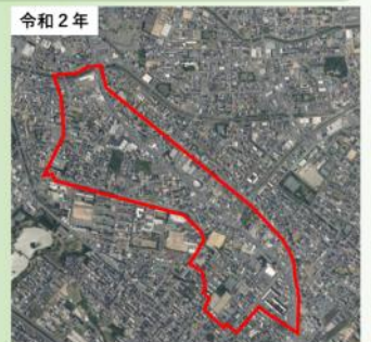
「空中写真データ」をもとに作成