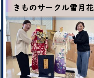
きものサークル雪月花

こどもスタンプラリーでは、ミナクルスタッフの愛犬4匹を、子どもたちがミナクル内を探し回りました。