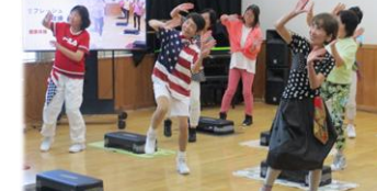
リフレッシュ体操