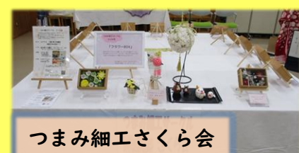
つまみ細工さくら会