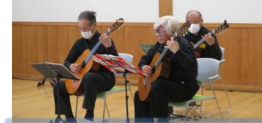
豊橋ギターアンサンブル