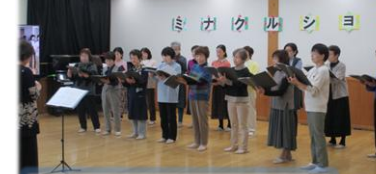
ハーモニーグリーン