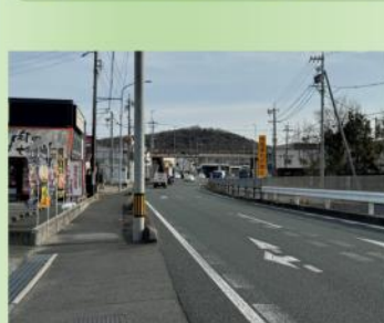
国道1号 撮影時期令和5年