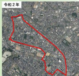
「空中写真データ」(国土院提供)をもとに作成 出典：国土院ウェブサイト