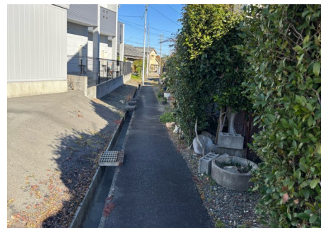
C：道路が狭く、整備されていない箇所