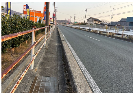
B：国道一号 歩道が狭い箇所