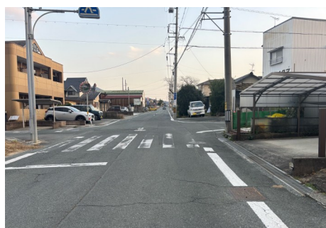
A：旧東海道 見通しの悪い交差点