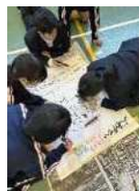
アイデアのつくり方