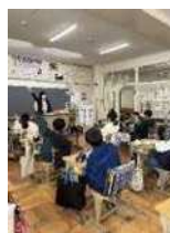
お金の大切さを学ぶ