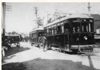
大手通りに並んだ市電

豊橋の近代化を象徴するもの一つの動きとして、市電の開通があります。大正12(1921)年に国の許可を得ますが、不景気や関東大震災の影響で計画は停滞します。それでも、発起人32人が資本金の半分を引き受け、残りを市民に募ることで道が開けました。大正14(1925)年、市電の営業がはじまり、街の風景が大きく変わってきます。こうして、都市計画と市電という2つの柱を軸に、近代都市への歩みを進めていきました。