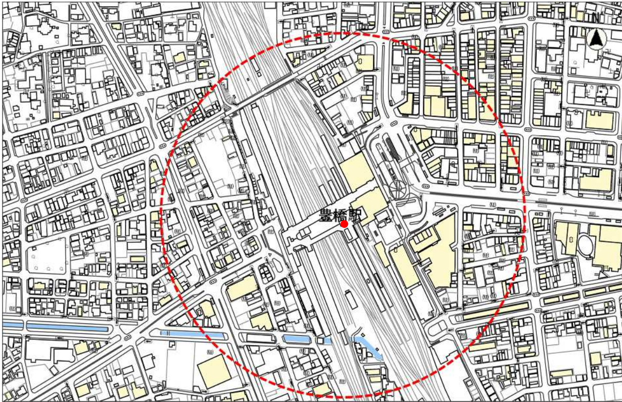
参考図（赤点線円は豊橋駅在来線改札口から半径約 300mを示します）

事業の趣旨（別紙2）に基づき、「豊橋駅在来線改札口を起点に半径約 300m以内」もしくは「豊橋駅在来線改札口まで徒歩約 5 分圏内」を想定しています。