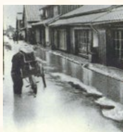
花田町地内のぬかるみ

上下水道の整備 昭和初期、総工費300万円以上をかけて上下水道の整備が進められ、昭和4(1929)年に通水しました。この工事は失業救済事業としても位置づけられ、延べ10万人が従事しました。また、当時は雨水や汚水を道路側溝へ流すなど衛生環境が悪く、大雨時には道路の冠水や床下浸水も発生していたほか、夏には伝染病蔓延の感染源となっていました。そのため、排水施設や下水処理場が建設されるなど、下水道の整備も本格化し、昭和10(1935)年に工事が完了しました。