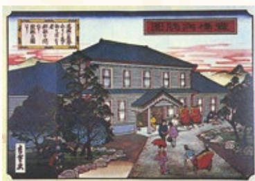
市立豊橋病院

市立豊橋病院の開設 昭和7(1932)年、市民福祉の向上を目的に、市立豊橋病院を開設しました。内科・外科・小児科など5つの診療科を設置したほか、一般・軽費(低所得者向け)・無料の診療制度を設けるなど、多くの市民が利用しやすい医療機関として整備されました。