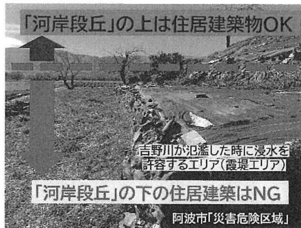
写真1 河岸段丘の地形を利用した危険区域設定