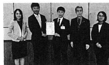
市長に予算要望しました