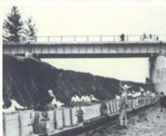
豊橋中学校生徒の勤労作業 「とよはしの歴史」より転載

戦時下の豊橋 昭和16(1941)年に太平洋戦争が始まると、町内会を通じて食料や衣料の配給が行われたほか、学徒動員によって学生たちが軍需工場で働くなど、市民の暮らしは大きく変わっていきました。 昭和20(1945)年には、空襲に備えて図書館の重要図書を疎開させる取り組みも行われ、戦時下でも文化を守ろうとする動きが見られました。