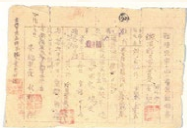
豊橋空襲の罹災証明書

終戦を経て復興へ 昭和20(1945)年6月19日深夜から20日未明に受けた空襲により、市街地の多くを失いました。同年8月の終戦後、人々は焼け跡からの生活再建に取り組みしましたが、食料不足により闇市が豊橋駅前まで広がるなど生活面で不安定な状況が続きました。 本格的な復興を目指し、新しく区画整理が行われ、市街地の再建や道路など生活インフラの整備が進められたことで、現在の豊橋の基盤が築かれていきました。