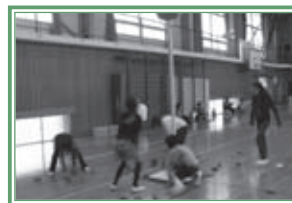
玉入れに似た「アジャタ」

トヨッキー基金への寄附は、随時受け付けています。この基金への寄附は税金の優遇措置があります。詳しくは市民協働推進課(☎51・2483) http://www.city.toyohashi.aichi.jp/shiminkyodo/