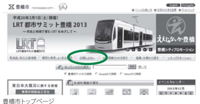
豊橋市トップページ