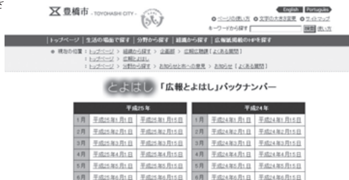
バックナンバーのページ

広報とよはしは、PDFファイル版、デジタルブック版として豊橋市ホームページ上で公開していますが、過去の広報とよはしを「バックナンバー」としてPDFファイルで見ることができます。現在は、平成14年1月1日号から最新号までの広報とよはしを置いてありますので、過去の情報が必要な場合は、ご利用ください。また、豊橋市トップページの上にある「広報とよはし」をクリックしたページには、直近3回分の広報とよはしへの目次が表示されており、ここから「デジタルブック版のページ」や「バックナンバー」のページ ( http://www.city.toyohashi.aichi.jp/koho/backnumber.html ) に行くことができます。