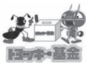
トヨッキー基金は随時受け付けています