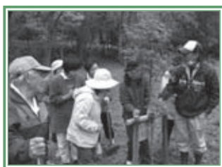
市民活動に企業の社員が参加

問い合わせ 市民協働推進課(☎51・2483) http://www.city.toyohashi.aichi.jp/shiminkyodo/kikin/