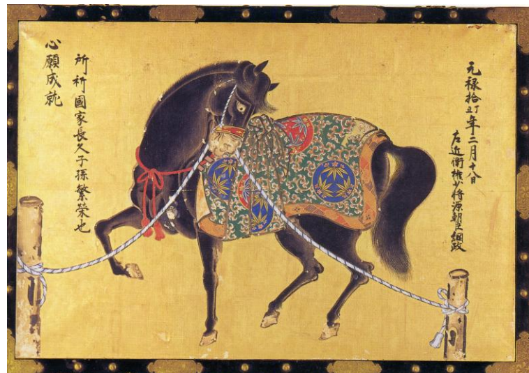
絵馬（大岩寺蔵 ※展示品は複製）