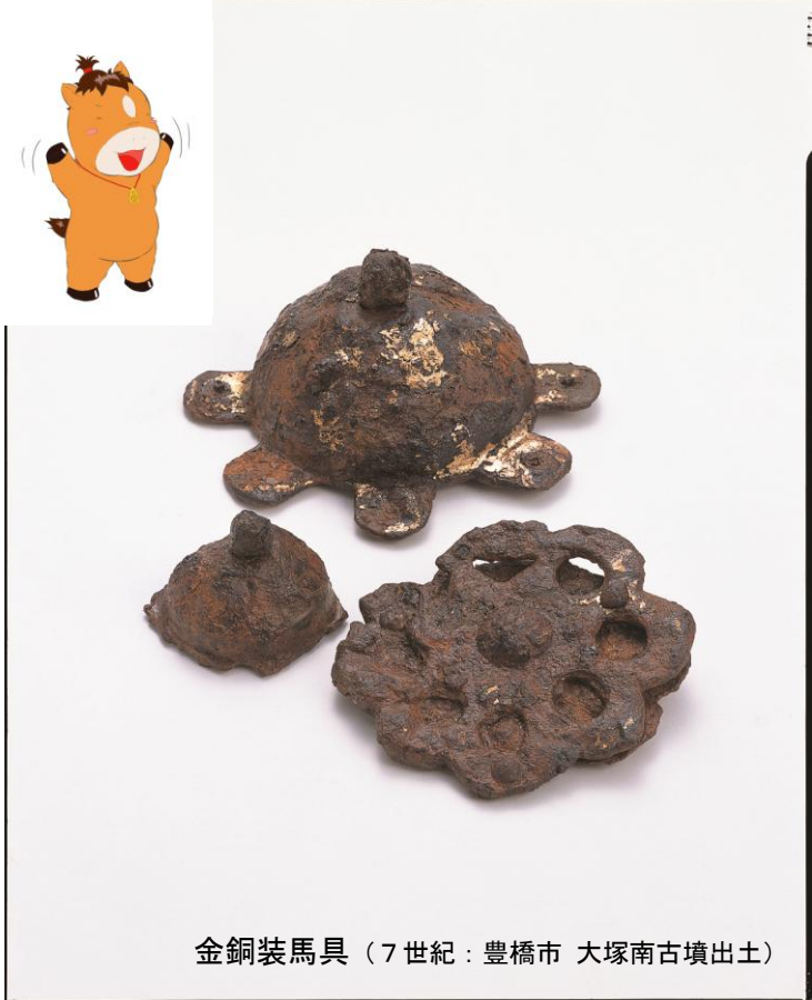
金銅装馬具（7世紀：豊橋市 大塚南古墳出土）