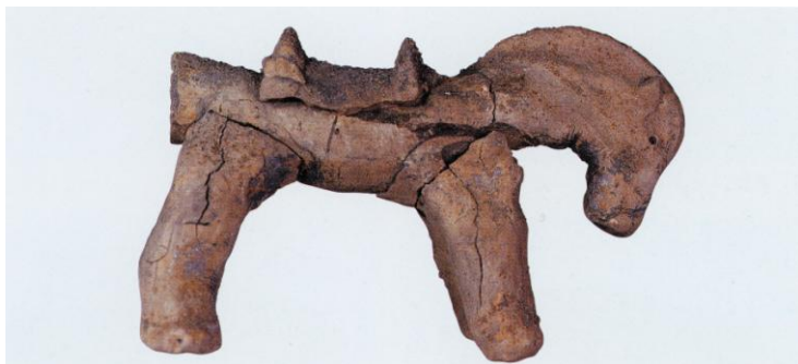
陶馬（8世紀：豊橋市 中田古窯出土）