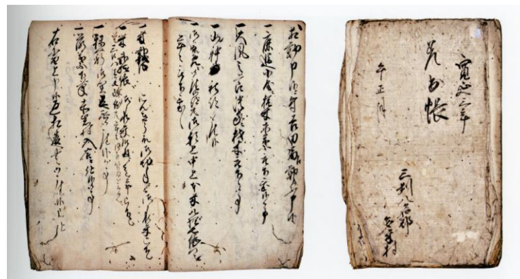
多米区有文書 差出帳 (豊橋市美術博物館蔵)