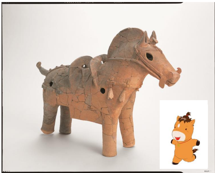
馬形埴輪（5～6世紀：岡崎市 外山3号墳出土）