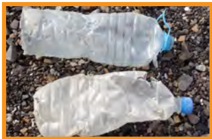
ポロポロになったペットボトル