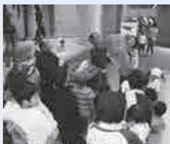
ボランティアガイドツアーのようす

とき: 毎週土・日曜日午後1時・2時(各約30分) 内容: イントロホール、常設展示室の見どころを最近の話題をまじえ、わかりやすく案内します