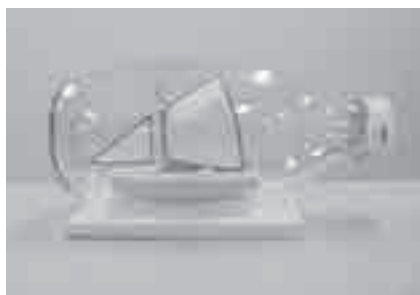
ボトルシップ(作品例)

とき ：8月9日(土)午前10時～正午 ところ ：カモメリア(神野ふ頭町) 対象 ：小学生以上(小学3年生以下は保護者同伴) 内容 ：ボトルシップの不思議な作り方を、実際に作りながら楽しく学びます 定員 ：30人(抽選) 参加料 ：無料 その他 ：同伴者の見学に定員はありません 申し込み ：7月23日(必着)までに返信先明記の往復はがきで代表者の住所・氏名・電話番号、参加者全員(1枚につき6人まで)の氏名・年齢、作成者・同伴者の内訳人数を港湾活性課「ボトルシップ」係(〒441-8075神野ふ頭町3-29☎34・3710)