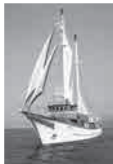
オーシャンプリンセス

とき ：7月21日(祝)①午前10時②午前11時30分③午後1時 ところ ：神野3号岸壁(神野ふ頭町) 対象 ：どなたでも(小学生以下は保護者同伴) 内容 ：重要港湾指定50周年を記念して、豊橋みなとフェスティバル2014で帆船オーシャンプリンセスに乗り、約40分かけて三河港を遊覧します 定員 ：各50人(抽選) 参加料 ：無料 その他 ：船内に段差があり、車いすや松葉づえでの移動は困難な場合がありますので付き添いの方同伴で参加してください 申し込み ：7月13日(必着)までに返信先明記の往復はがきで代表者の住所・氏名・電話番号、参加者全員(1枚につき6人まで)の氏名・年齢、希望時間番号(1枚につき1