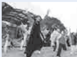
昨年の競舞部門の様子