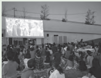
ここにこ芝生シアター(昨年のようす)

とき ：7月27日(日)午後7時～9時 内容 ：閉店後のゲームセンターで動き出す、人間が知らない「ゲームの裏側」の世界のお話「シュガー・ラッシュ」を芝生広場で上映。映画館とは違った雰囲気、映画を楽しむことができます 参加料 ：無料