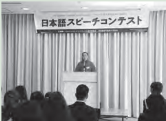
昨年のスピーチコンテストの様子

詳細はホームページ http://www.toyohashi-tia.or.jp/ 参照