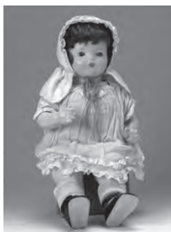
青い目の人形 コネタ

とき: 8月2日(土)・3日(日)午前9時30分～午後4時30分 ところ: こども未来館ここにこ(松葉町三丁目) 内容: [両日開催] 常時展示/青い目の人形・豊橋の戦争遺跡写真展・戦時中の生活用品など 随時/平和の絵本の読み聞かせ・しおり作り・昔の遊び・ とらふ 燈籠作りの体験コーナーなど [8月2日(土)] 午前10時/パネルシアター「エセル・ディーン物語」、午後1時/小学生による平和についての発表、午後2時/豊橋の戦争遺跡の紹介 [8月3日(日)] 午後2時40分/戦争体験を聞く会 入場料: 無料 問い合わせ: 教育会館(☎33・2113)