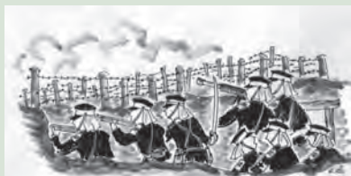
ほうてん 奉天会戦での豊橋歩兵第18聯隊 れんたい 太田幸市画

とき/内容: ①7月30日(水)～8月15日(金)午前8時30分～午後5時/ 昨年の平和を求めて図書館資料展の内容を紹介 ②8月4日(月)午前8時30分～午後5時/原爆がスター・戦時中のまちなみパネル展示 ③8月4日(月)～8日(金)午前9時～午後4時/戦争体験談DVDの視聴 観覧料: 無料 問い合わせ: ①については中央図書館 ②③については行政課(☎51・2028)