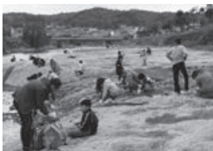
昨年の化石採集の様子

とき: 11月15日(土)午前8時45分～午後4時30分(雨天決行) ところ: 岐阜県瑞浪市 集合・解散: 豊橋市自然史博物館※バス使用 対象: どなたでも(小学生以下は保護者同伴) 内容: 1600万年前のサメ・貝化石などを採集します(雨天の場合は瑞浪市化石博物館で特別講義を聞きます) 講師: 当館学芸員 定員: 40人(抽選) 参加料: 1,000円 申し込み: 10月30日(必着)までに返信先明記の往復はがきで教室名、参加者全員の住所・氏名・年齢・電話番号を自然史博物館「化石採集」係(〒441-3147大岩町字大穴1-238 ☎41・4747)