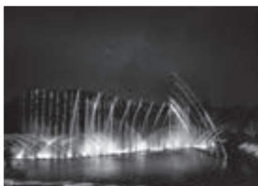
噴水エンターテイメント

みかん狩りの後は、360度どこからでも堪能できる噴水エンターテイメントで一休み。音楽と色鮮やかなライトに彩られた幻想的な水の空間を、ぜひお楽しみください(10月は毎日午後7時・8時の2回開催。観覧料大人600円、小人400円)。 詳しくは、はままつフルーツパーク時之栖ホームページ( http://www.tokinosumika.com/hamamatsufp/ )をご覧ください。