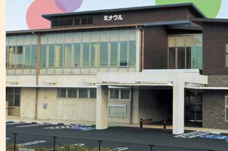
豊橋市大清水まなび交流館