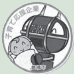
豊橋市子育て応援企業認定マーク

市民や従業員に対する子育て支援の取り組みを積極的に進めている企業を「豊橋市子育て応援企業」として認定し、特に優れた取り組みを行っている企業に対して表彰を行いました。認定された企業には認定証および認定マークを交付し、こども未来館ここにこ（松葉町三丁目）におけるパネル展示や市ホームページ（ http://www.city.toyohashi.gijp/1516.htm ）などで取り組みを紹介します。 認定条件 次の3分野のうち、2つ以上の分野にわたって取り組みがあり、一定基準を満たすこと①子どもと一緒に利用できるサービスや設備の提供②地域における子育て・子育て支援③子育てしながら働きやすい職場環境づくり