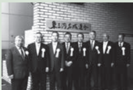
1月30日に行われた除幕式の様子