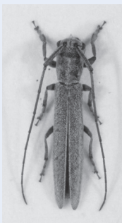
新種のカミキリムシ(コレオカラモビウス・パランテナーツス)

日本と韓国では共通の種類も多く見られますので、もしかしたら、日本からも発見されるかもしれません。