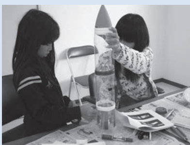
ペットボトルロケットを作ってみよう