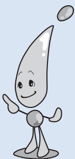
水の展示館マスコット すいてきくん

とき 3月14日(土)午前10時～午後3時 ところ 水の展示館(西赤沢町字大坂 万場調整池管理事務所内) 対象 どなたでも(小・中学生は保護者同伴) 内容 ペットボトルロケットを作ってみよう、竹の水鉄砲作り(射的ゲーム)、ポンポン船(レース対決)、スーパーボールすくい、水の実験コーナー(浮沈子・水笛)、利き水大会(豊川の水を当てる景品をもらおう)など、子ども向けのイベントが盛りだくさんです 参加料 無料 申し込み 不要