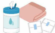
ウェットティッシュ・タオル・生理用品