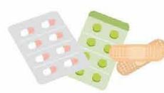
処方箋でもOK! 応急グッズがあるとGood! 常備薬