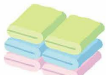
毛布の代わりにもなります バスタオル