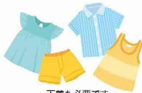
下着も必要です 衣類