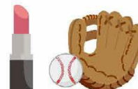
化粧品や自分のお気に入りグッズなどがGood! 元気づけてくれるもの