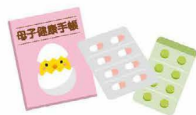
処方箋でもOK! 母子健康手帳や薬