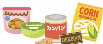
アレルギーのある場合は少し多めに おかしや非常食