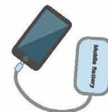
充電器も一緒に! 携帯電話