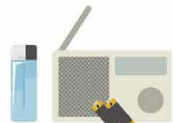
電池も忘れずに! 携帯ラジオ・ライター