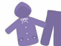
ポンチョでも代用できます レインコート