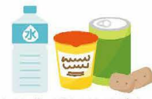
すぐに食べられるものがGood! ガムは歯磨きに代用できます 水・非常食