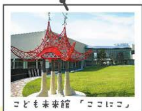
こども未来館「ココロココ」