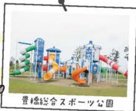
豊橋総合スポーツ公園