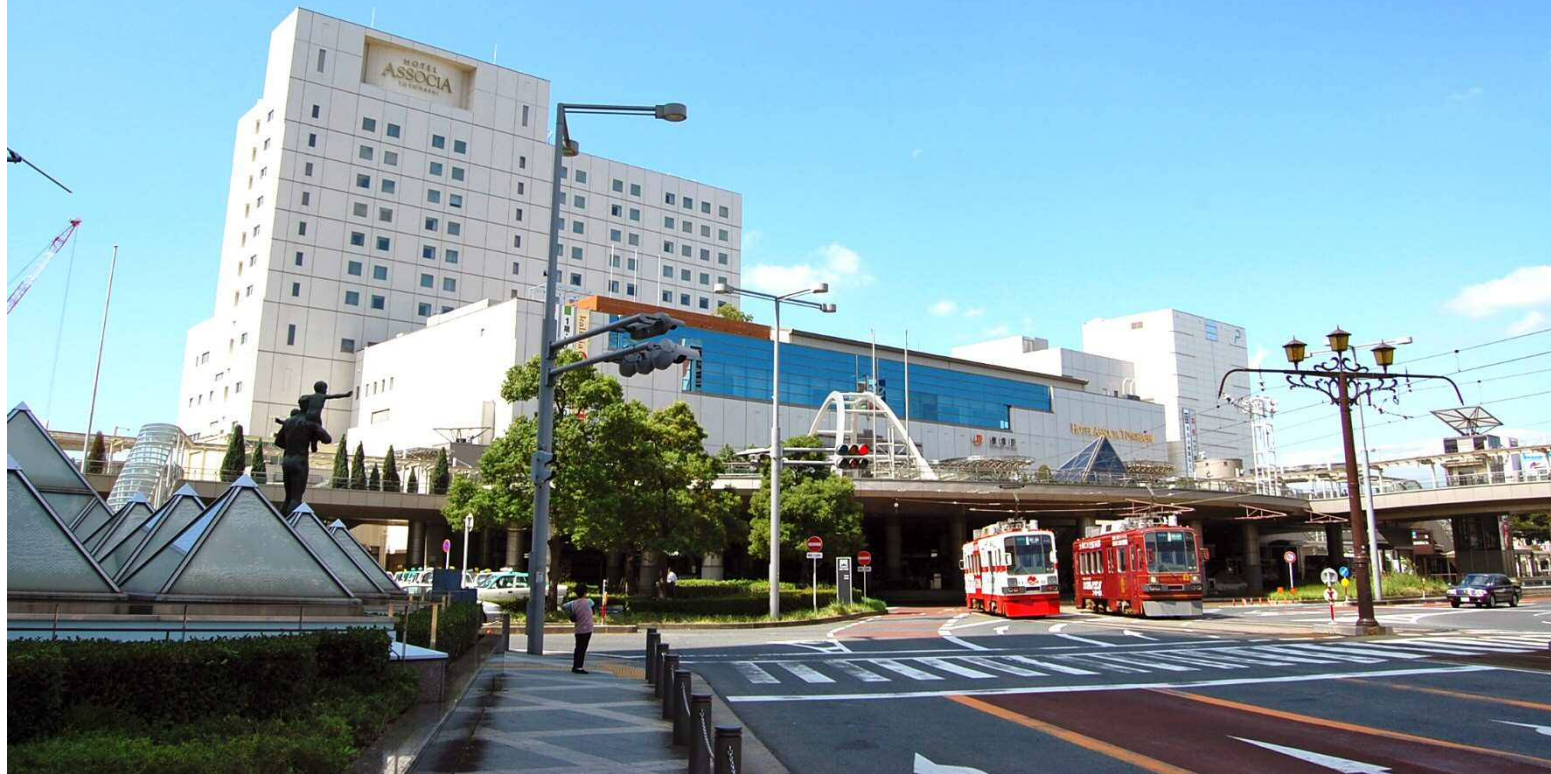
豊橋市サテライトオフィス誘致補助金