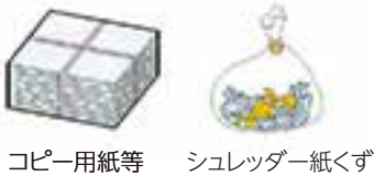
コピー用紙等 シュレッダー紙くず

シュレッダー紙くずは一部の業者のみ受入れ可能です。以下の古紙リサイクルヤード一覧でご確認ください。