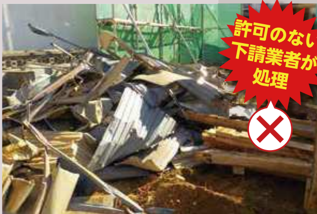
〈建設工事に伴い発生する廃棄物〉