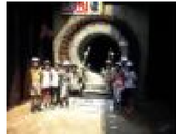
うめだ だい おすい かんせん 梅田第2汚水幹線 (大山町)見学会2000年7月

みなさんが使って汚れた水(汚水)は、下水道管に流れこみ、下水しより場まで運ばれ、浄化されて、きれいな水によみがえります。この下水道のしくみは、どのようになっているのでしょうか。